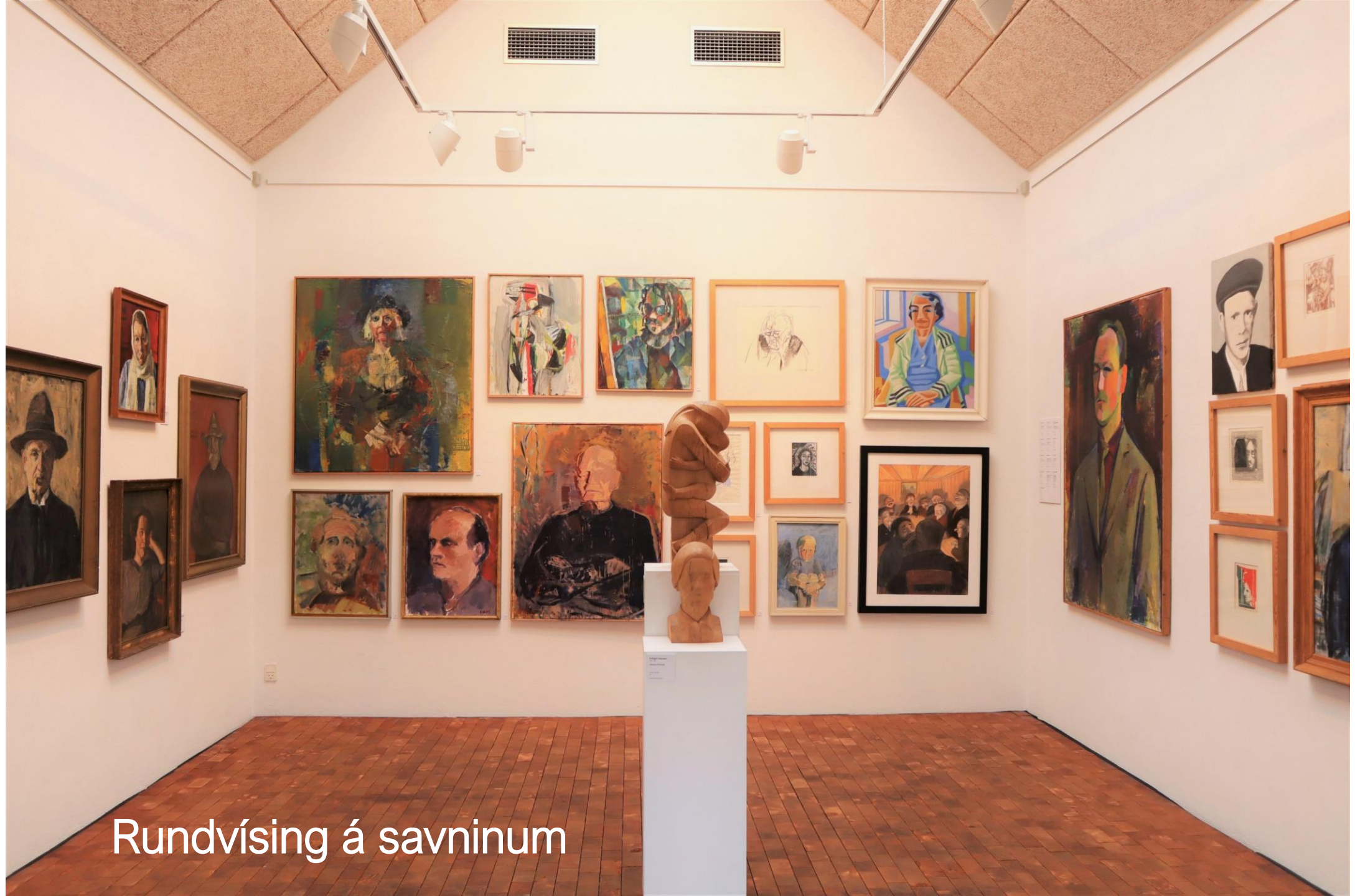
Rundvísing á savninum