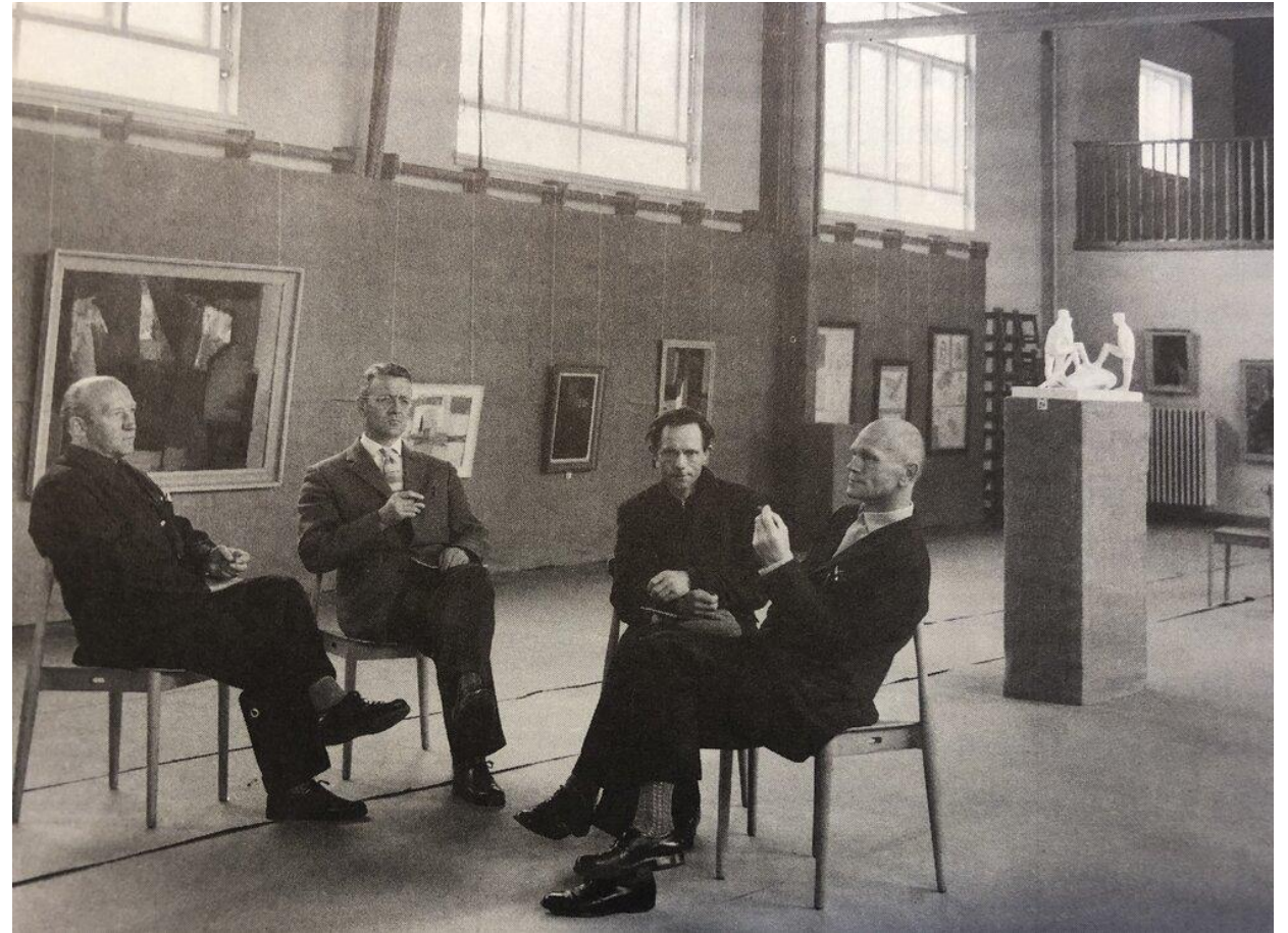
William Heinesen, Hanus við Høgadalsá, Steffan Danielsen og Janus Kamban á Ólavsøkuframsýningini hjá Listafelagnum í 1958