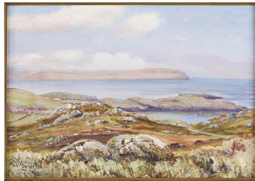
Jógvan Waagstein, Hoyvík , 1940